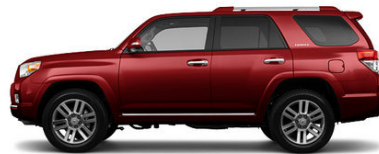
Salsa Red Pearl