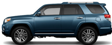
Shoreline Blue Pearl