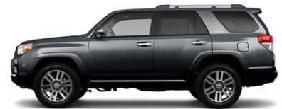
Magnetic Grey Metallic