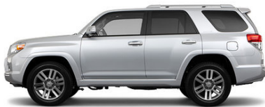
Classic Silver Metallic